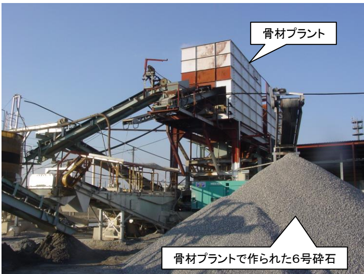
骨材プラントと周辺の様子